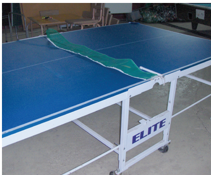
TABLE DE PING-PONG À VENDRE! TRÈS PEU UTILISÉE ET EN BON ÉTAT ! 50 $ NÉGOCIABLE! Si cette magnifique table vous intéresse, vous pouvez venir nous voir au local des Ados le vendredi entre 19 h et 22 h.